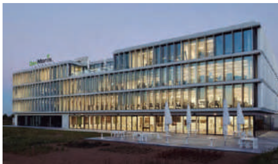
Sede central DocMorris, Heerlen (NL)