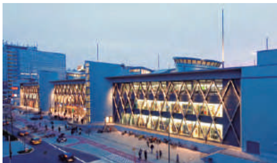
Centro comercial Rheinpark-Center, Neuss (DE)