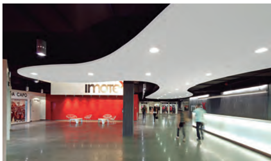
Centro de Moda Imotex, Neuss (DE)