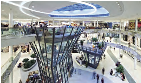
Centro comercial Milaneo, Stuttgart (DE)